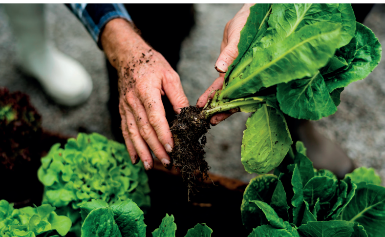
Bild 1 (Ernte): © Rawpixel.com - stock.adobe.com, Bild 2 (Kuh am Hang): © Robin Weaver - stock.adobe.com

À l'époque, les paysans des régions alpines étaient aussi des agriculteurs, des céréaliers, des maraîchers et, bien sûr, des producteurs de lait et des bergers. Le paysage des Alpes du Nord reste toutefois très différent de celui des Alpes du Sud. Bien que ce phénomène s'explique en partie par la géologie et le climat, il a aussi été largement influencé par le mode d'exploitation agricole. Le paysage dans les Alpes – et on ne parle pas ici des vallées industrielles, des villages transformés en résidences de vacances ou des hautes montagnes – reste en grande partie dominé par la nature. Différents paysages comme l'orée des forêts, les prairies et pâturages en fleurs, les terrasses, les champs, les prairies ou bien les pâturages des Alpes, ont quant à eux été façonnés par l'homme. D'autres éléments historiques du paysage sont apparus dans le cadre de l'exploitation agricole, tels que les vieux sentiers, les haies, les clôtures, les murs en pierre et dans le Valais où les pluies se font rares, les nombreux canaux d'irrigation artificiels également appelés bisses. Enfin, les bâtiments tels que les fermes, les étables, les granges et les greniers situés en dehors des villages marquent également le paysage culturel et contribuent considérablement à son attractivité.