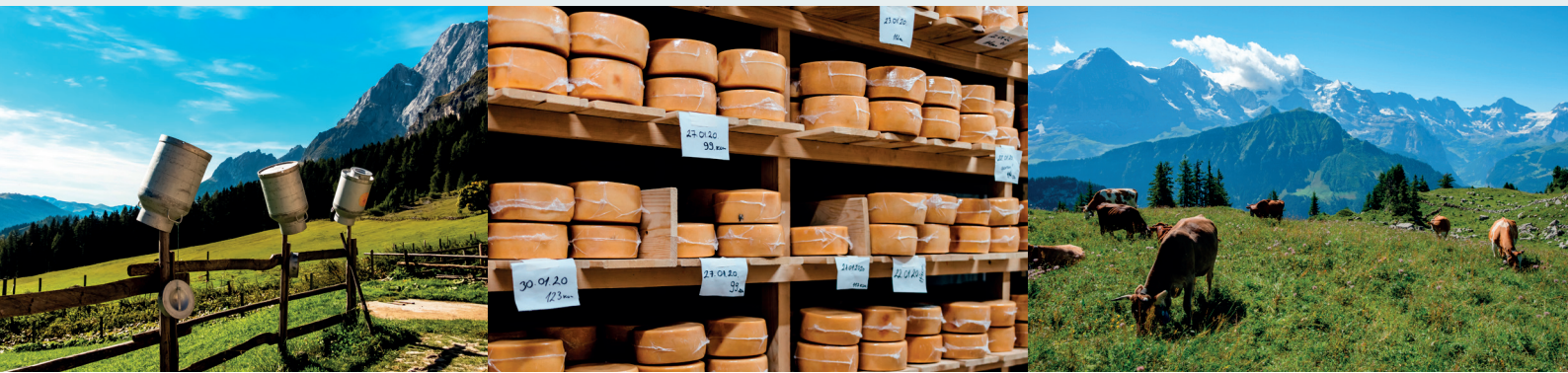
Bild 1 (Milchkannen): © Gina Sanders - stock.adobe.com, Bild 2 (Käseproduktion): © Dusko - stock.adobe.com, Bild 3 (Kühe auf der Wiese): © brunck1 - stock.adobe.com

Dans les Alpes du Sud, la culture et l'élevage occupaient à peu près la même importance. Les paysans utilisaient les surfaces ensoleillées comme champs, tandis que les prairies et les pâturages étaient repoussés sur des sites plutôt ombragés en hauteur. Aujourd'hui encore, on peut observer les restes de ces cultures en terrasses dans le Valais, le Tessin et même dans l'Oberengadin. Les céréales spécialement adaptées à l'altitude étaient cultivées jusqu'à 1'800 mètres. À présent, la culture dans les montagnes est un produit de niche qui peut toutefois être rentable pour les agriculteurs.